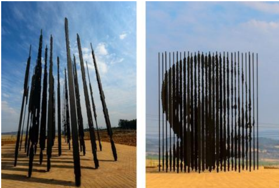
Monumento a Mandela en Howick

“No soy un profeta, sino vuestro humilde servidor”