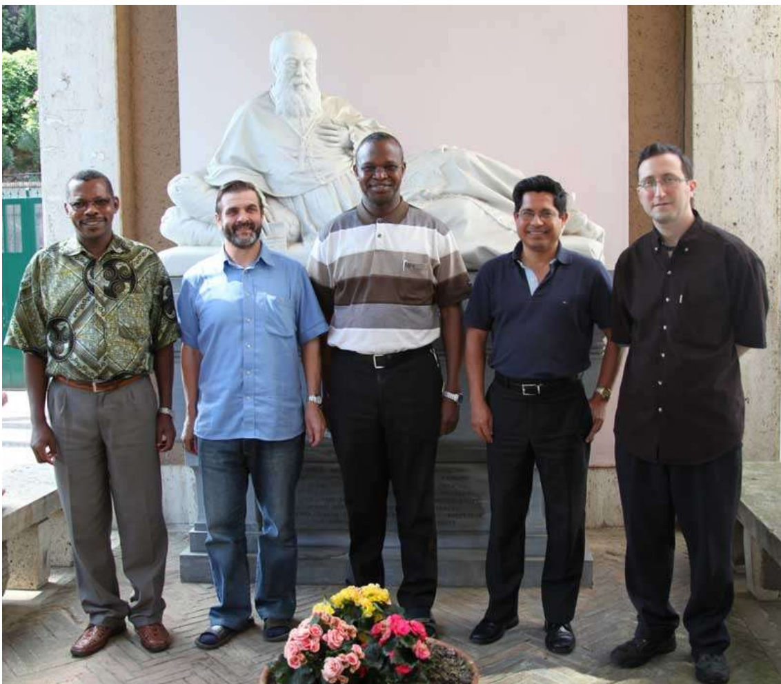
En la foto, los miembros del Consejo General de los Padres Blancos.

Esa fue la razón por la que Carlos Lavigerie insistió para que nos adaptásemos, en cuanto a lengua, vestido, comida, vivienda y costumbres se refiere, a los pueblos a donde estábamos llamados a servir, rechazando solo lo que se oponía a la moral o a las sanas costumbres. Quería que respetásemos lenguas, usos y costumbres. Quería que en todo tiempo y lugar fuésemos fermento de concordia y unidad.